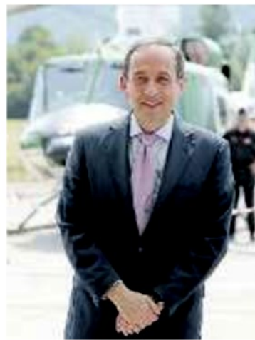
Bonetti a pagina III IL PREFETTO Francesco Esposito

Carabinieri, polizia di Stato e Finanza, secondo quanto pattuito nel piano (sottoscritto da Anas e dalle ditte) possono entrare liberamente nei cantieri in qualsiasi momento. Lo hanno già fatto 56 volte. Ci sono state irregolarità? Il prefetto Francesco Esposito non può entrare nel merito ma dice: «Anche evitare che ci siano infiltrazioni è un risultato, il migliore. Questo sistema è un patrimonio che non vogliamo disperdere e vorremmo estendere alle Olimpiadi. Stiamo da tempo monitorando con attenzione anche il ciclo dei ri-fiuti».