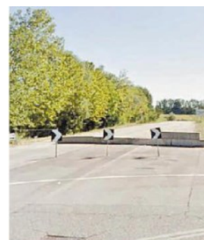
Il punto d'innesto a Conegliano