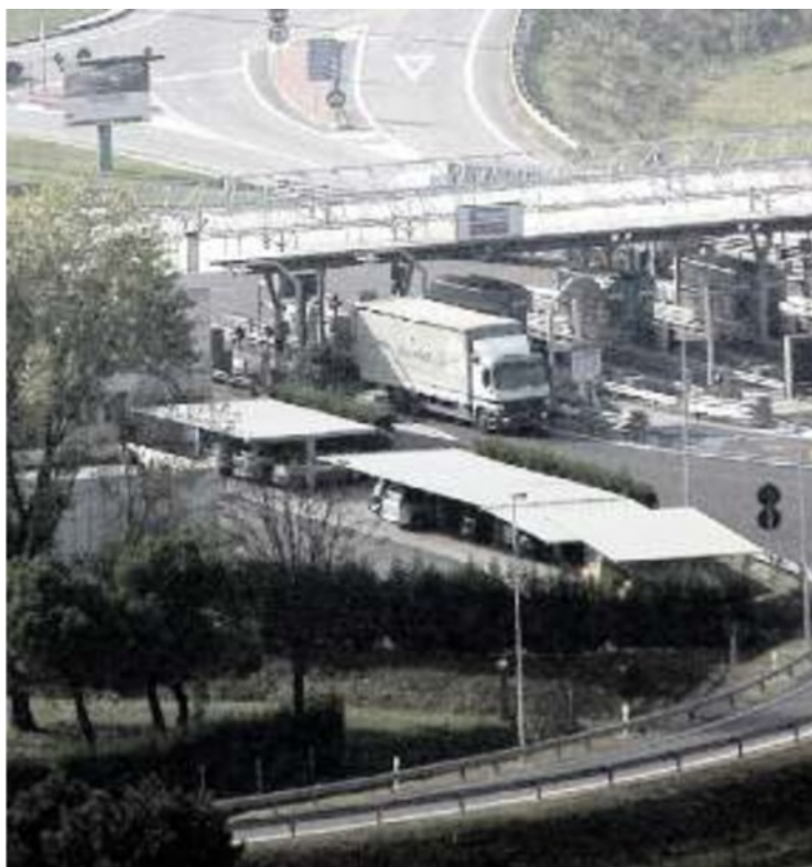
IL NODO Il casello di Montecchio, confluenza tra A4 e Pedemontana