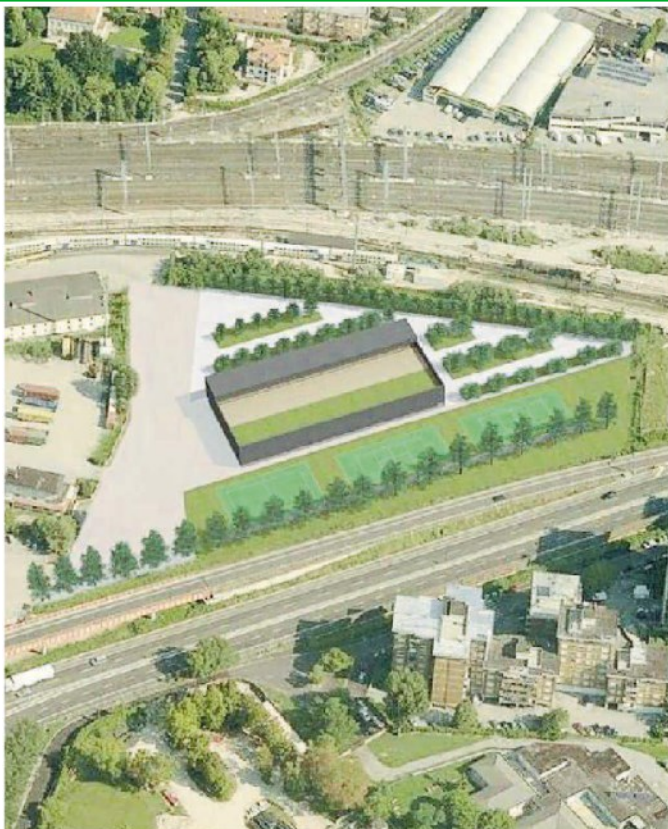
L'ipotesi di area fitness dello studio Op Architetti