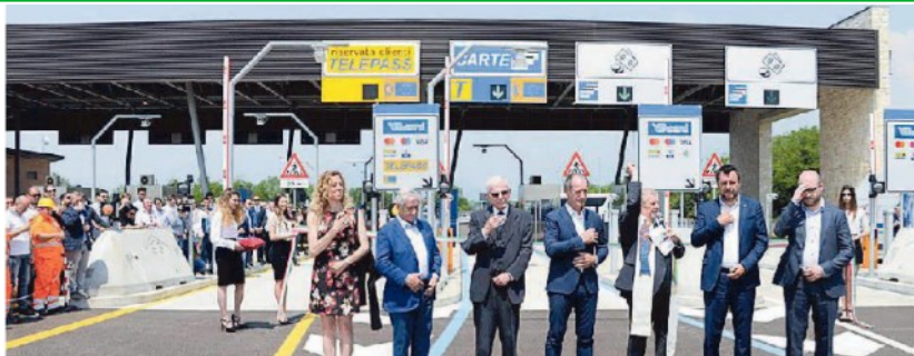
L'inaugurazione del primo tratto della Pedemontana