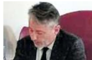
SINDACO DI MONTECCHIO MAGGIORE (VICENZA) Gianfranco Trapula