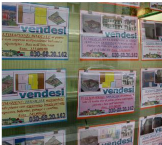
A Bardolino il picco dell'incremento dei prezzi: +2,2%