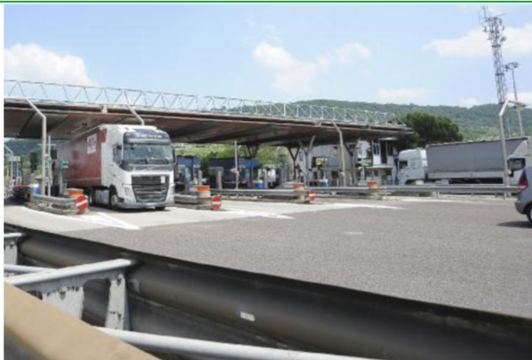
Uno scorcio dell'attuale casello autostradale della A4 di Montecchio Maggiore ad Alte.

A quel punto, afferma la struttura di progetto Spv, la Regione ha proposto un accordo di programma con Ministero, Autostrada e Ferrovia, e di inglobare tutte le opere in un unico appalto, comprese quelle complementari alla Pedemontana, affinché venissero costruite in contemporanea e che avrebbe gestito direttamente. Ma Anac, Autorità nazionale anti corruzione, ha ritenuto non percorribile la situazione e quindi Autostrada si è attivata per affidare i lavori. Oggi, individuato il raggruppamento temporaneo di imprese per i lavori del nuovo casello (costituito da Icm Spa, Carron Cav. Angelo Spa e Icop Spa e che ora resta in stand-by) per un progetto da 62 milioni di euro, per consegnare i lavori è necessaria la sottoscrizione della convenzione con Rfi. Che ancora non c'è. Perché? Perché, dice la struttura di progetto di Spv, «Rfi non è in grado di sottoscrivere alcun atto, considerate le molte incertezze sulla possibilità di realizzare la loro infrastruttura». Del resto, questo governo - frenato dalla linea pentastellata - ha messo la Tav nel limbo. Una situazione intricata, in cui ora però tutti i nodi vengono al pettine. «Siamo preoccupati: convochiamo - ha concluso Trapula - le categorie economiche, la Regione, la Provincia e tutti i Comuni del territorio». ●