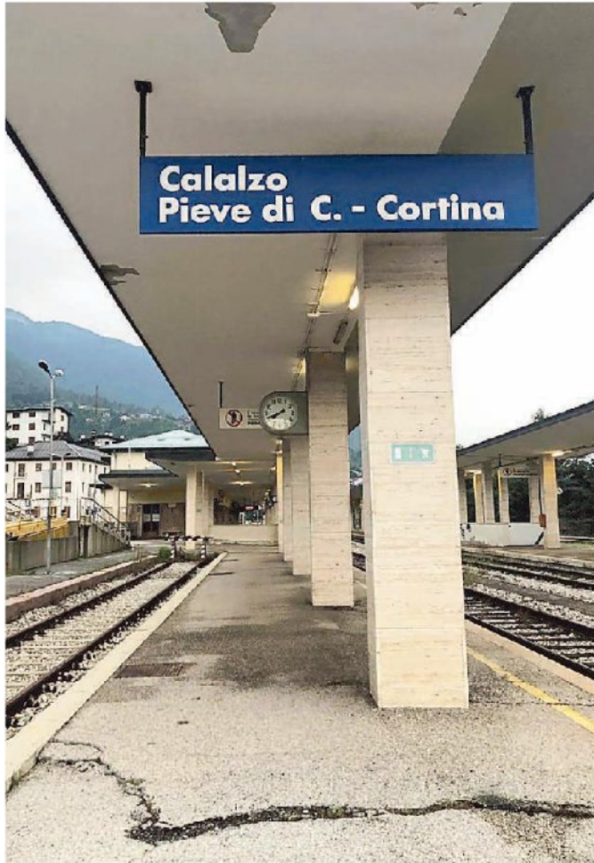
La stazione di Calalzo