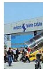
Lo scalo L'aeroporto Valerio Catullo