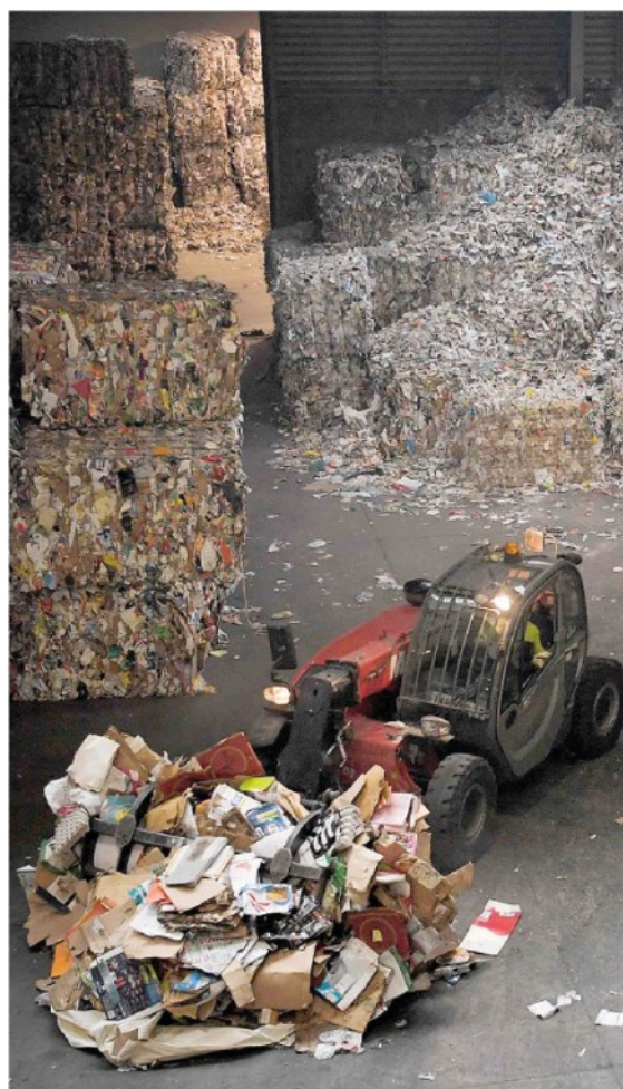
Economia circolare. Appello delle imprese al Governo per sbloccare il riciclo