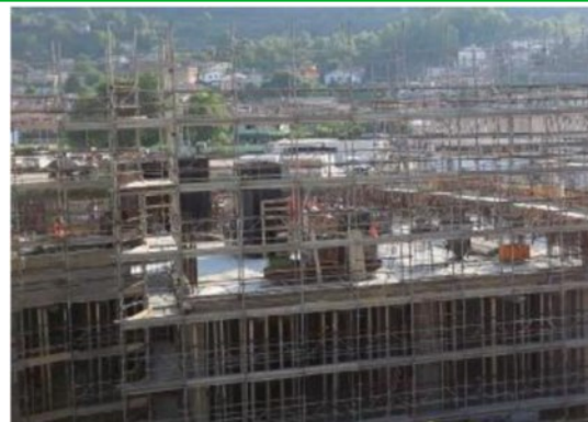
La realizzazione dei piani del nuovo ospedale unico di Montecchio. A.F.