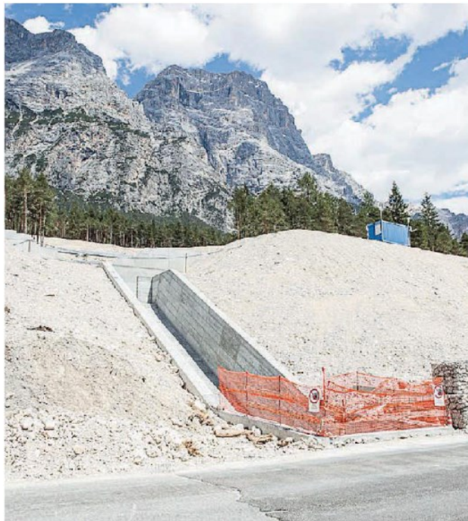
Uno dei cantieri in corso sull'Alemagna

In Cadore, dunque, bisognerà armarsi di un supplemento di pazienza, ancora per un anno e mezzo. Non è stato facile, in questi giorni, transitare per l'Alemagna a Valle di Cadore, e specificatamente a Valesella. Proprio sulla curva, le imprese dell'Anas hanno cominciato un cantiere importante che prevede la rimessa in sicurezza del ponte. Sul posto si transita lungo una sola corsia e il traffico è regolato dai movieri. Nelle ore di punta si formano code lunghe anche più di un chilometro e la circostanza sta irritando non solo i residenti, ma soprattutto i turisti. Il fatto è che di cantieri in programma ce ne sono una quarantina e che tutti (o quasi) vanno conclusi entro la fine del 2020. In zona si attendono poi le varianti, ma l'Anas assicura che questi cantieri non interferiranno sulla mobilità quotidiana. Sul versante del Comelico, i lavori del traforo sono attesi tra il 2021 e il 2022 perché l'Anas si è data tempi necessariamente lunghi per la progettazione. Sta proseguendo, però, la costruzione della galleria paramassi ai piedi di Coltrondo. Il prossimo anno, il Comelico sarà inoltre interessato da tutta una serie di piccoli cantieri, lungo la Statale che porta fino al passo Monte Croce Comelico: verranno “addolcite” alcune curve, saranno ricostruiti dei ponti, si consolideranno dei muri di sostegno dei versanti, nulla però di complesso. —