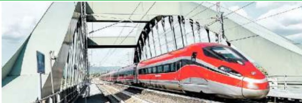
SUI BINARI Nell'immagine di repertorio, un Frecciarossa della flotta di Trenitalia in Veneto