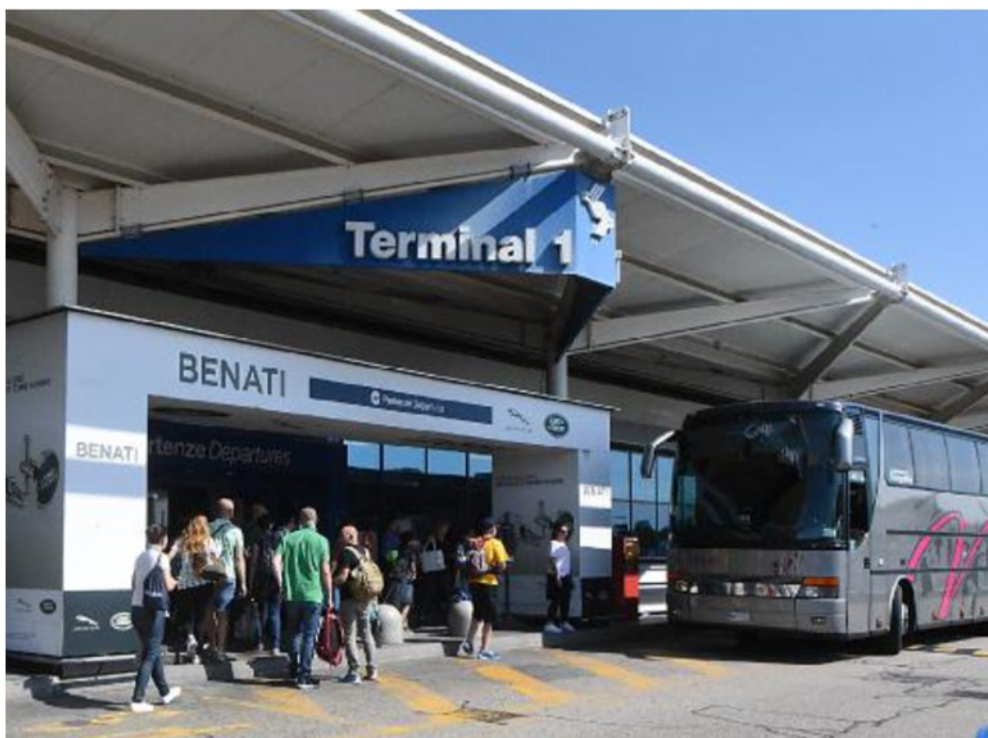
L'aeroporto Catullo: il Cipe ha finanziato il collegamento con Verona con un tratto di linea a Dossobuono