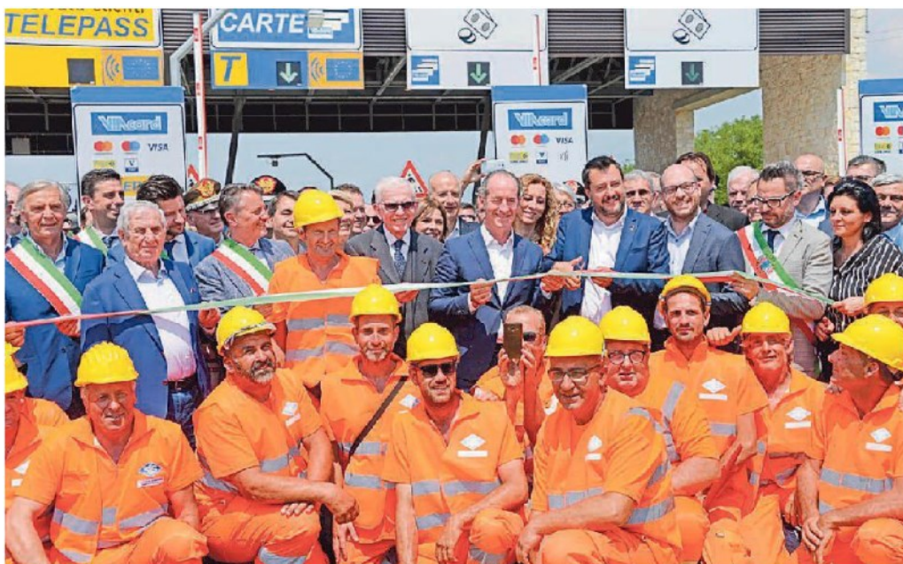
L'inaugurazione del primo tratto della Pedemontana a Breganze. Salvini Zaia tagliano il nastro