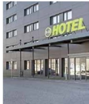
• Il B&B Hotel di Trento

A Castello Sgr (partecipata tra gli altri da Isa e Itas) fanno capo attività immobiliari valutate circa 2,3 miliardi di euro. Tra queste anche il fondo Clezio, proprietario del quartiere delle Albere.