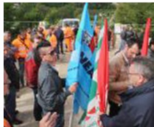
Sindacati nel cantiere