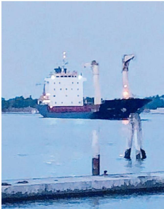
La nave cargo Amira Joy incagliata al porto di Chioggia