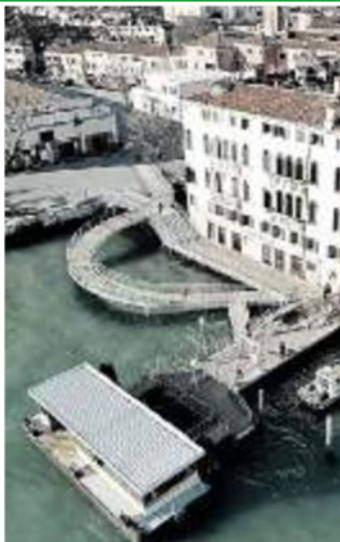
SAN BASILIO Il progetto del ponte Molin