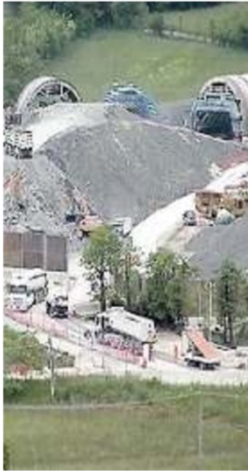
L'AREA La galleria di Malo