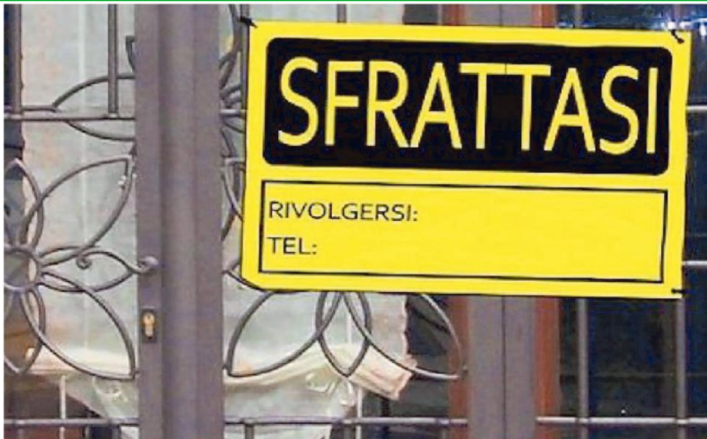
Sfratti, in calo il numero degli sfratti