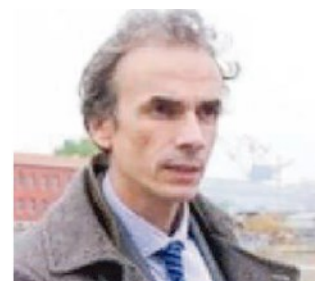
Andrea Ferrazzi, senatore Pd