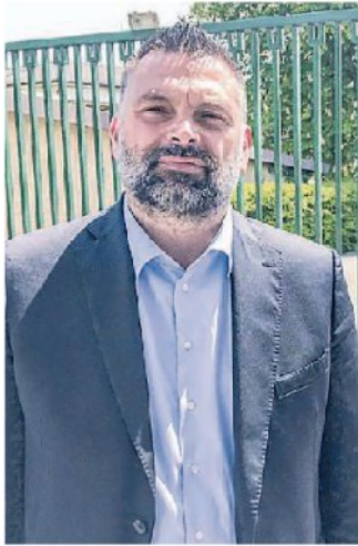
LUCA DE CARLO È IL SINDACO DI CALALZO DI CADORE E DEPUTATO DI FRATELLI D'ITALIA