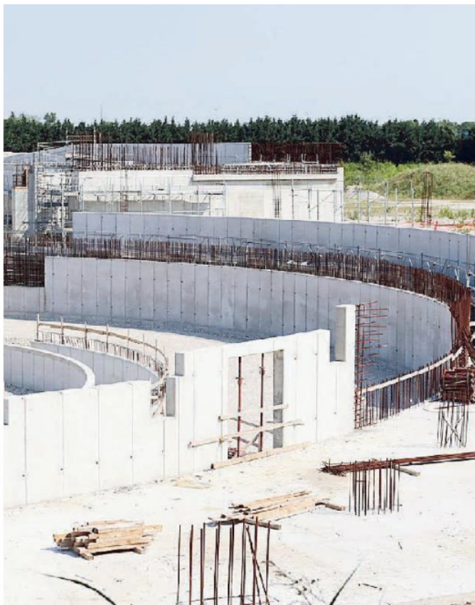
A sinistra il sottosegretario Giorgetti lo scorso anno a Lovadina all'inaugurazione del cantiere. A destra lo stato attuale del Velodromo