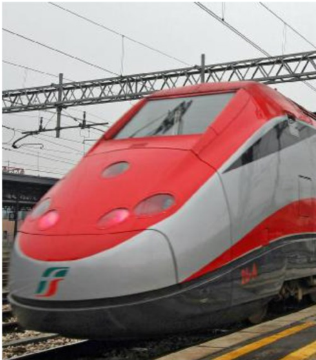
Un treno ad alta velocità e alta capacità