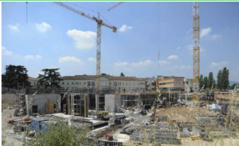
Uno scorcio del cantiere del nuovo ospedale unico Montecchio-Arzignano in costruzione.