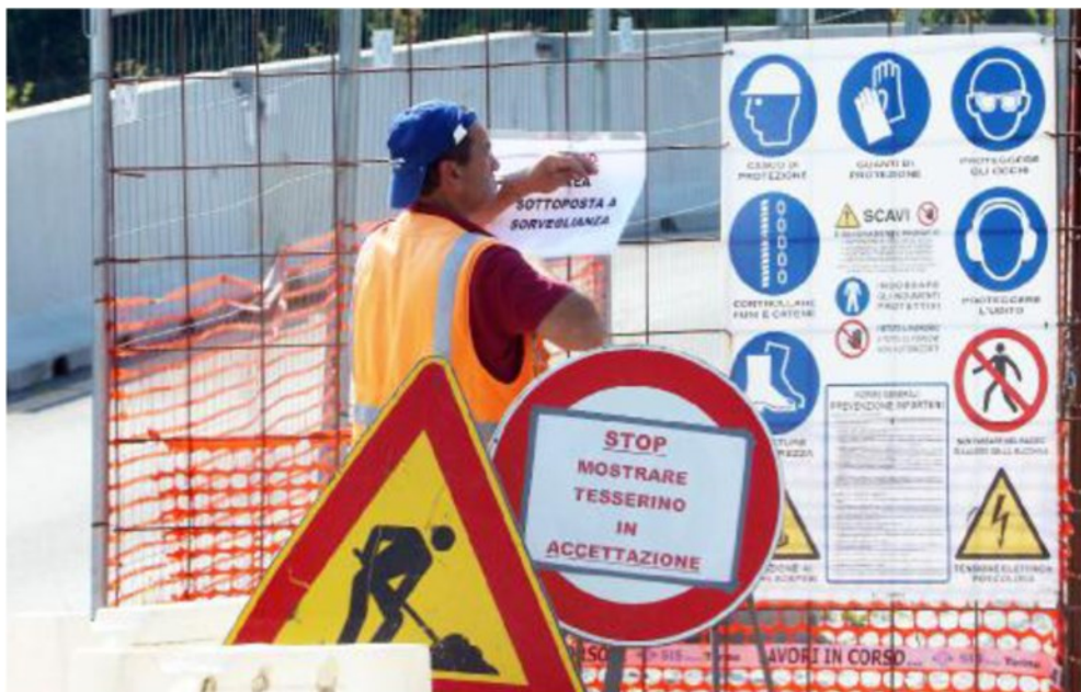
Il cantiere della Pedemontana a Vallugana posto sotto sequestro.