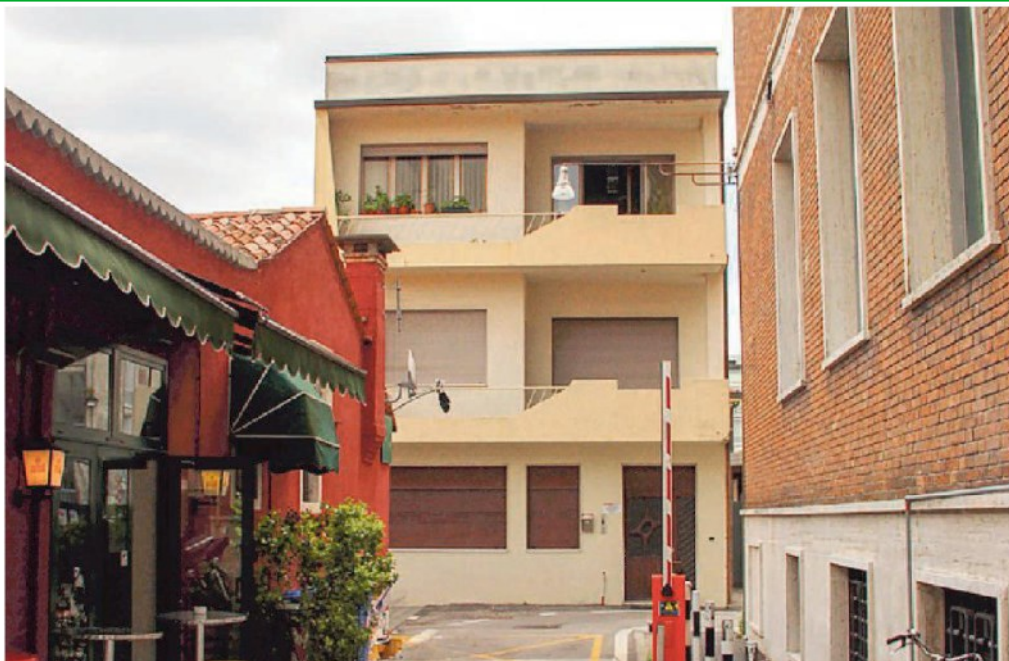
L'edificio ex Meucci tra Corte Legrenzi e il distretto del Museo del Novecento (M9)