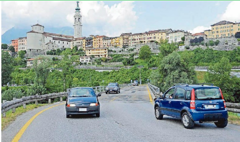
Il ponte bailey a Lambio