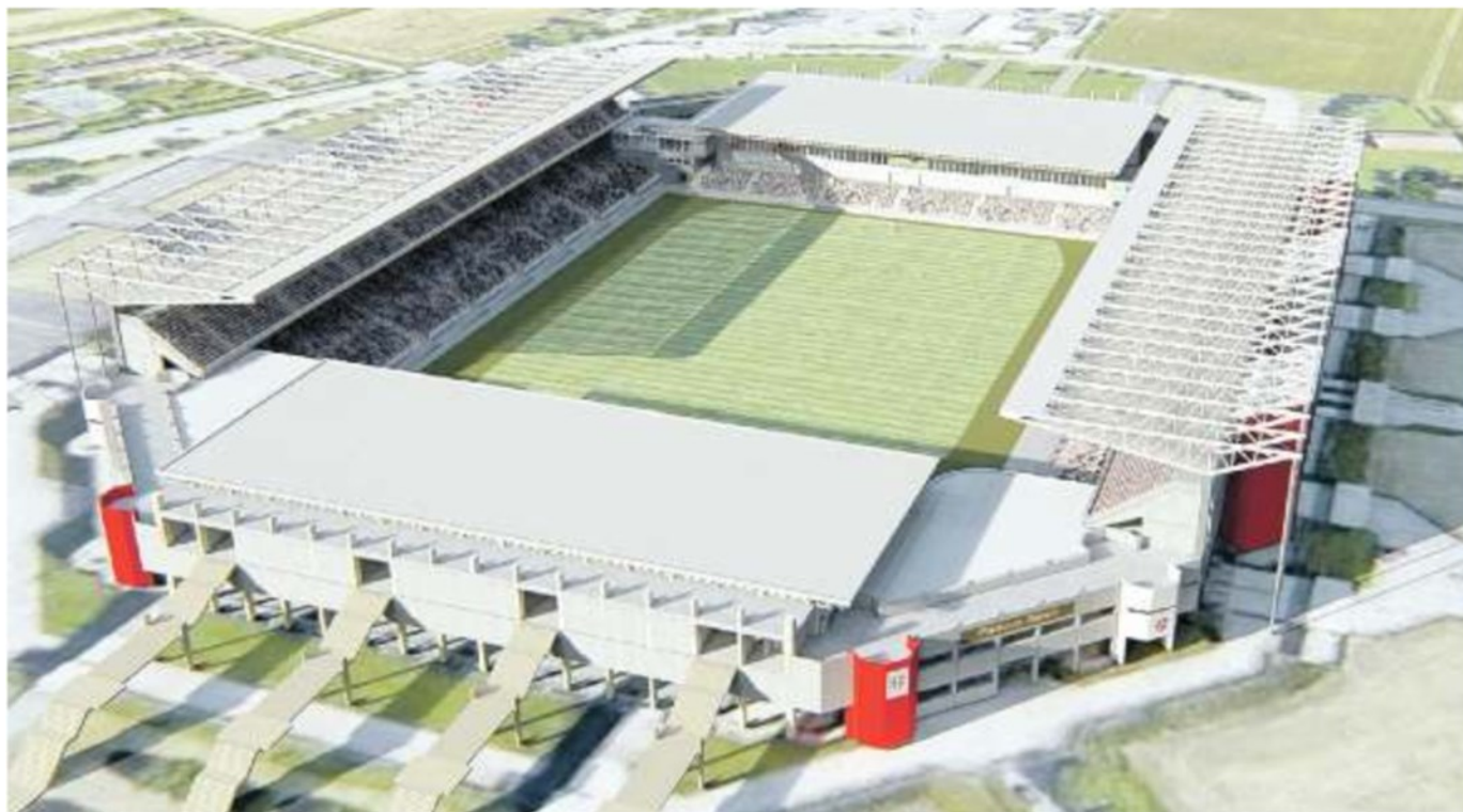
IL RENDERING Ecco come apparirà lo stadio Euganeo all'inizio del campionato 2021-2022 secondo il cronoprogramma dei lavori

(A.R.) Mentre il progetto dello stadio va avanti non si ha più alcuna notizia sulla realizzazione dell'arena della musica che avrebbe dovuto trovare posto proprio di fianco all'Euganeo. A realizzare la struttura avrebbe dovuto essere Zedlive che dall'altra parte di corso Australia dovrà gestire una nuova struttura in muratura che andrà a sostituire entro dieci anni il gran Teatro Geox. Questo nell'ambito del recupero dell'area dell'ex mercato del bestiame che entro due anni ospiterà il nuovo punto vendita di Leroy Merlin.