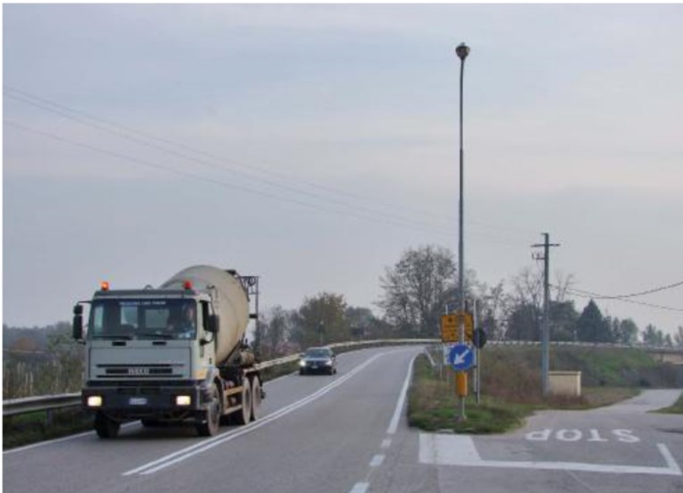
L'accesso al ponte Delaini, tra i cinque manufatti dove presto si interverrà