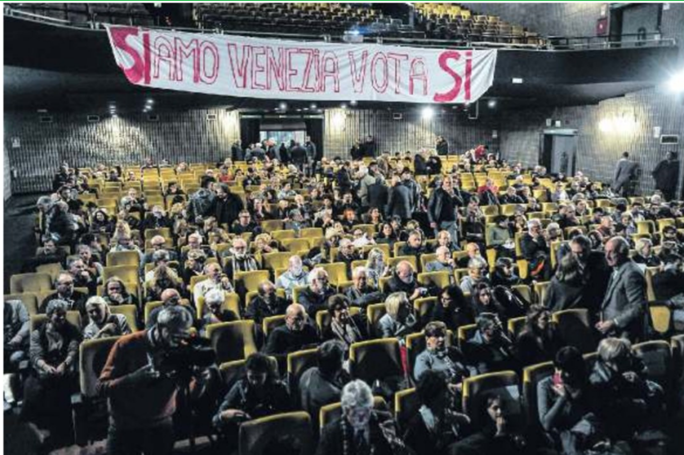
IERI A MESTRE La platea di ieri al teatro "Corso" per il confronto tra tre sostenitori del "sì" alla separazione e tre contrari