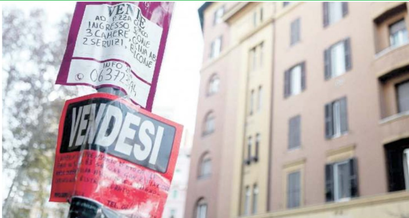
BORSINO IMMOBILIARE Si muove il mercato in città anche se la situazione non è ancora tornata ai livelli normali