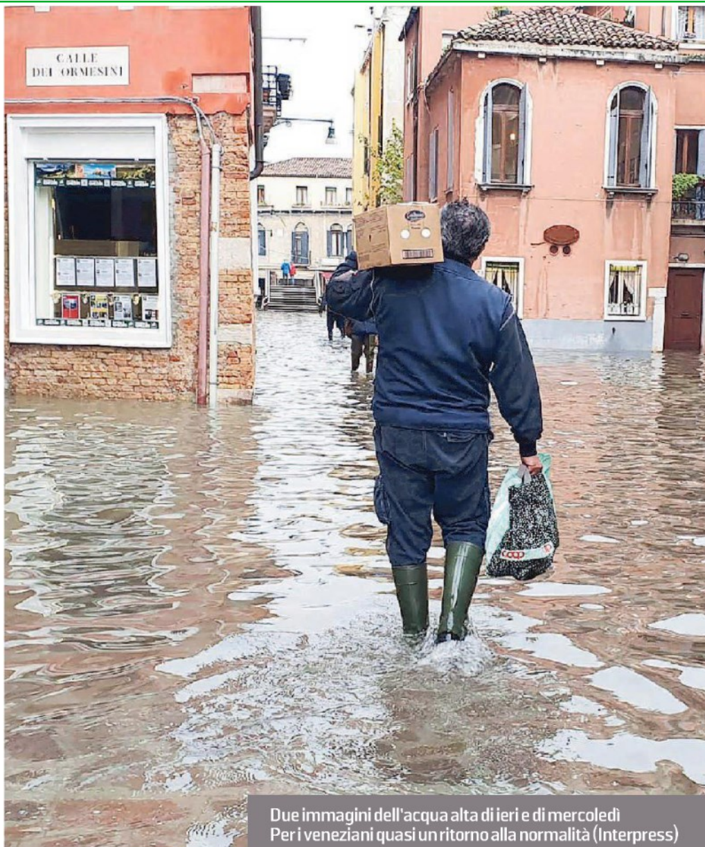
Due immagini dell'acqua alta di ieri e di mercoledì Per i veneziani quasi un ritorno alla normalità