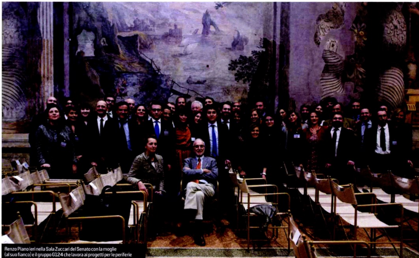
Renzo Piano Ieri nella Sala Zuccari del Senato con la moglie (al suo fianco) e il gruppo G124 che lavora ai progetti per le periferie