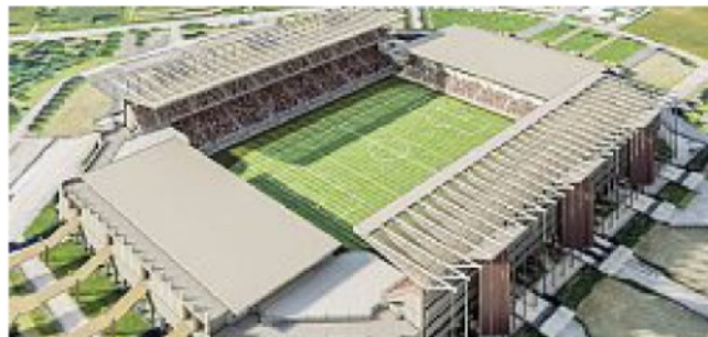
Rendering Uno dei disegni progettuali per il restyling dell'Euganeo