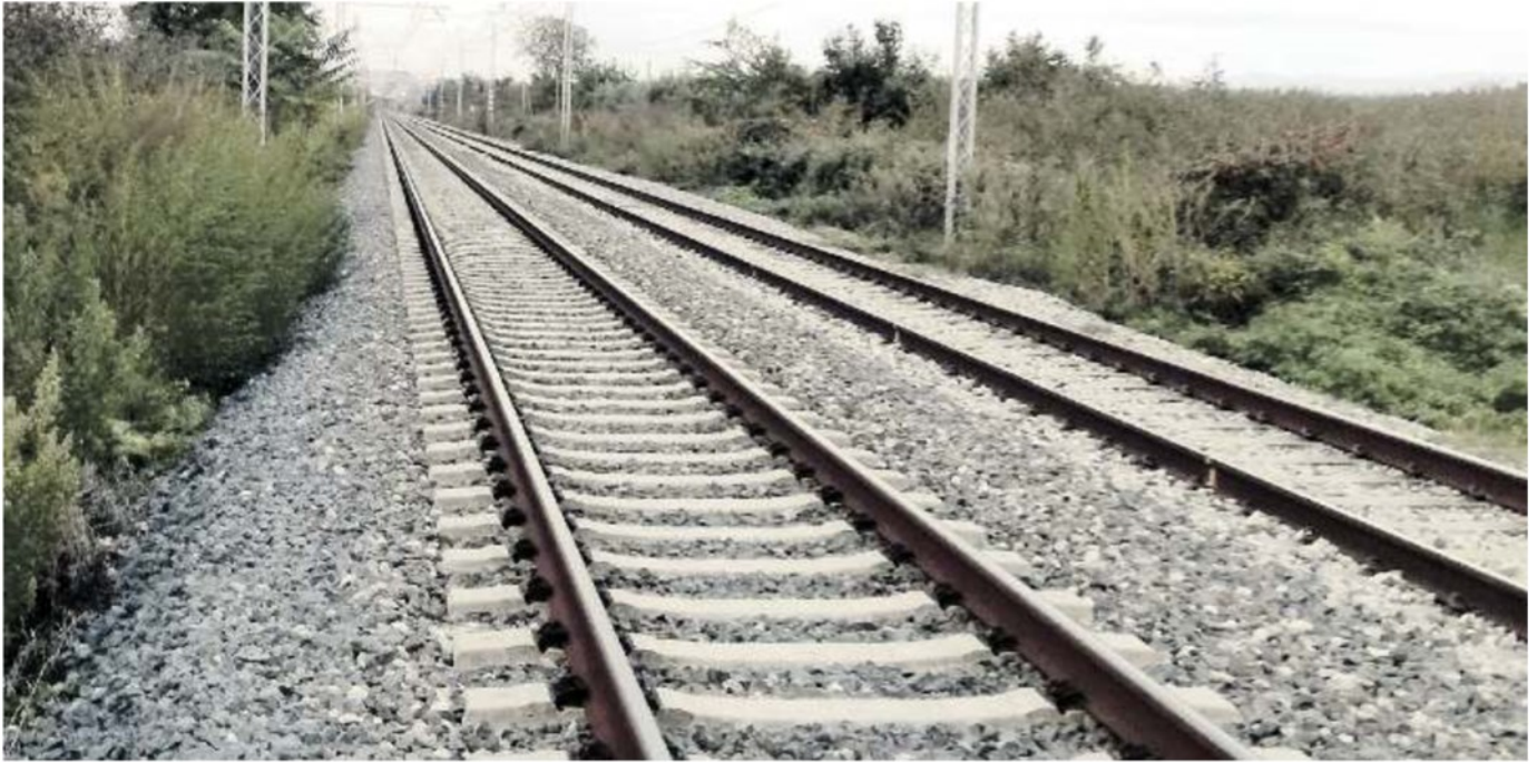
A RILENTO Sui due binari della linea ferroviaria tra Padova, Rovigo, Ferrara e Bologna i treni non superano i 150 chilometri orari