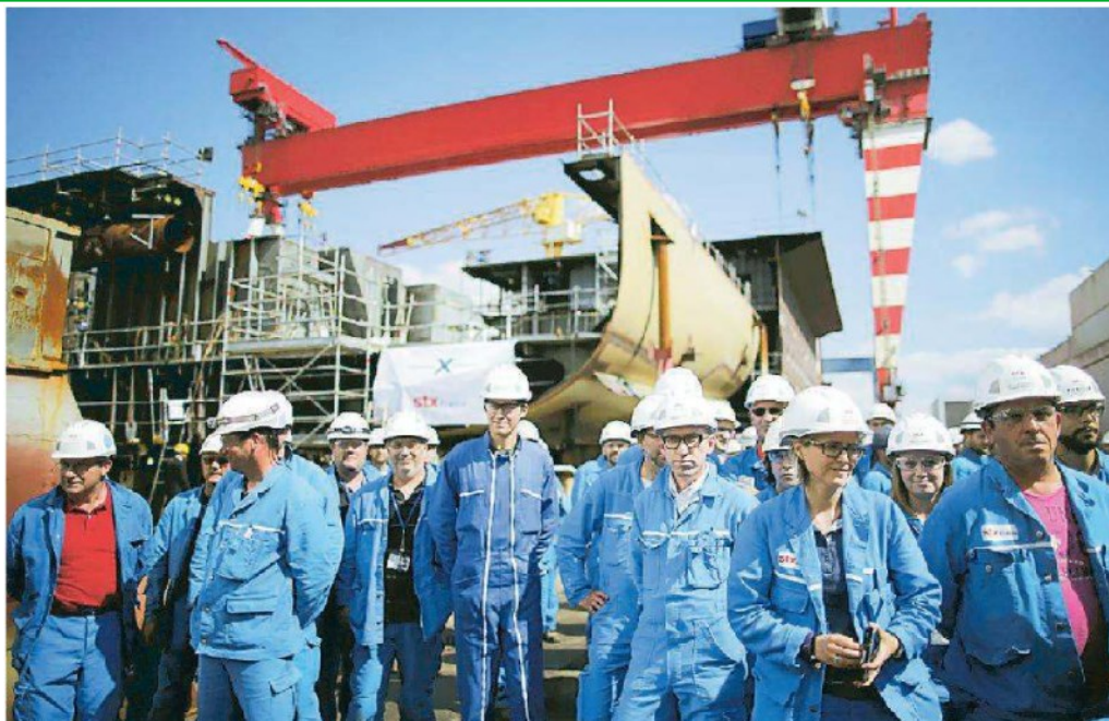
I cantieri francesi di Stx acquisiti da Fincantieri e finiti nel mirino dell'Antitrust Ue: le assicurazioni di Parii