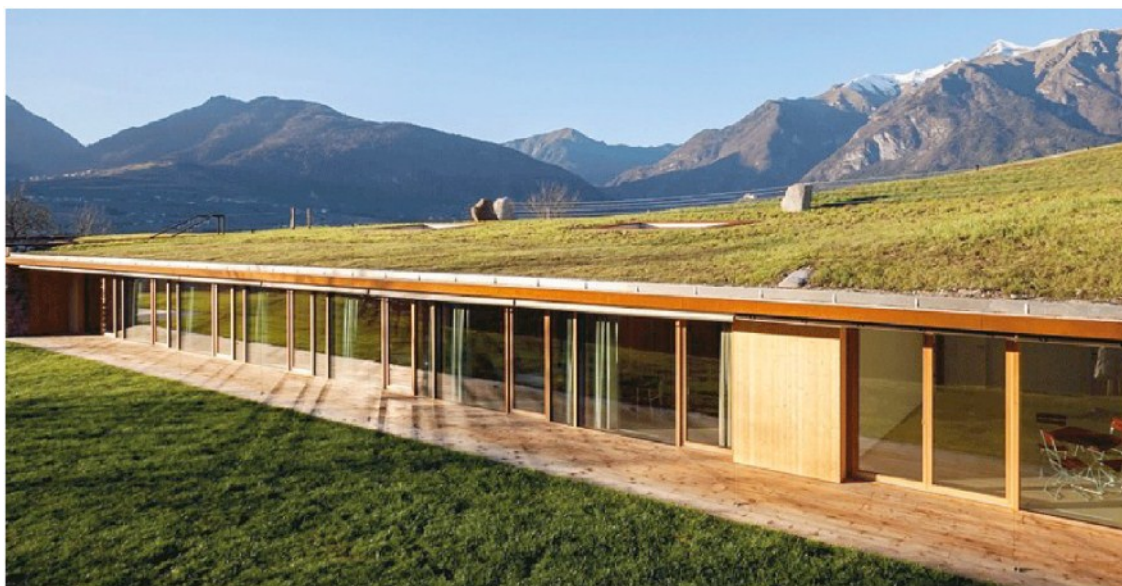
Un prato sul tetto. Casa Riga a Comano Terme (Tn) è un b&b in legno inglobato nel terreno: finalista a CasaClima 2016