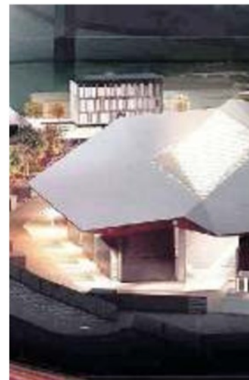
IN ATTESA Il progetto della piscina di Marghera