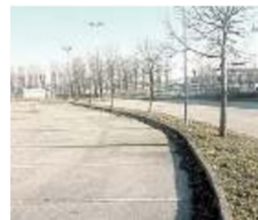
PISCINA L’area individuata