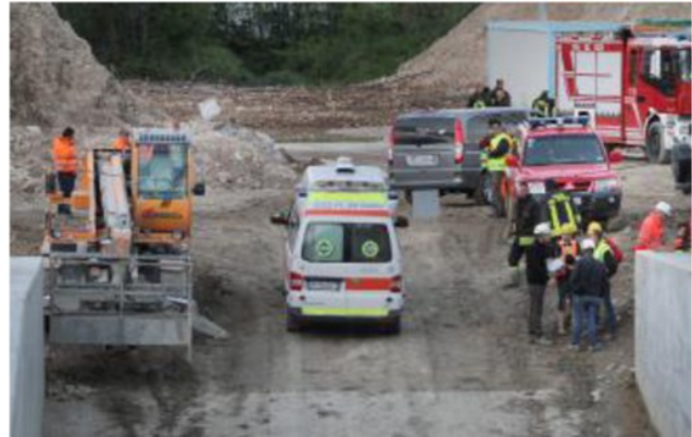
La tragedia avvenuta nel cantiere della Pedemontana

Davanti al giudice saranno discusse anche le posizioni dei singoli imputati, che si difendono con forza assicurando di avere agito con correttezza e nel rispetto delle normative. ●