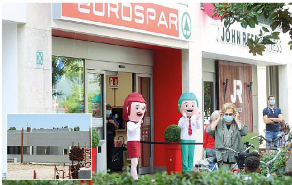
Valzer di marchi In via Carducci ha aperto Eurospar, nella zona Aev Terraglio è in costruzione Lando

● La preoccupazione maggiore riguarda i lavoratori, tra Tom e Auchan ci sono 150 persone che ancora non sanno cosa faranno