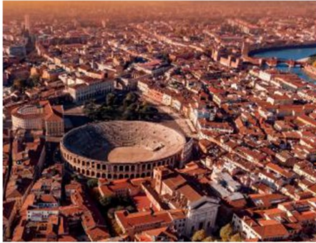
Una panoramica del centro di Verona