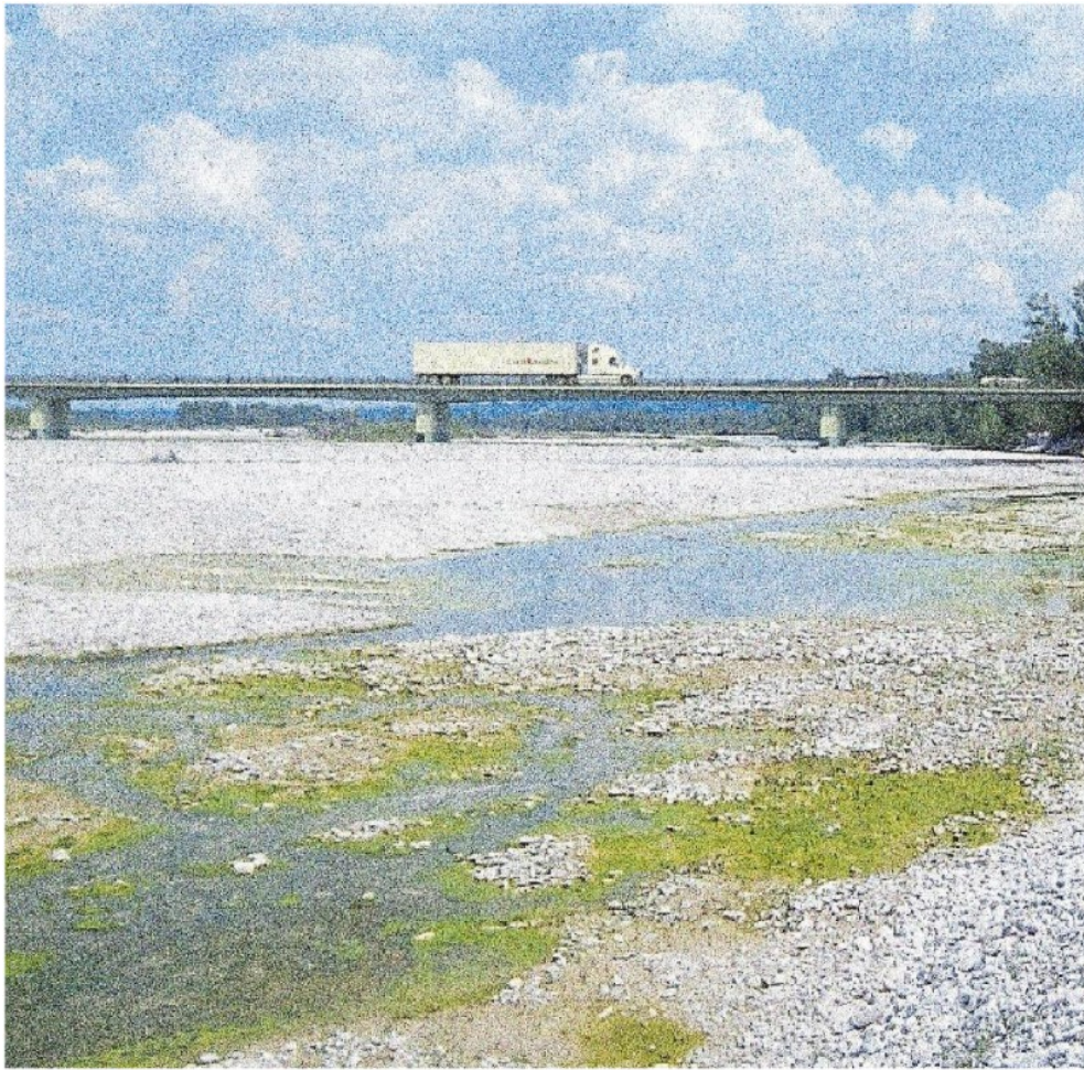
Il progetto per "sdoppiare" il ponte di Vidor prende forma: si va alla valutazione d'impatto ambientale