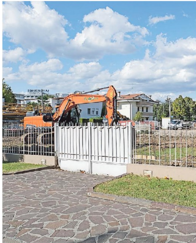
L'area della villa storica demolita in via Don Bosco