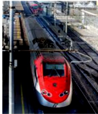
La linea Tav, priorità anche per Zaia

Potenziare e mettere sempre più in rete le infrastrutture come strade, ferrovie, Tav, aeroporti, sviluppando la logistica. Ma anche investire su quelle digitali. Poi autonomia regionale, turismo, lavoro, meno burocrazia. E dare risorse alla formazione professionale. Per rendere più forte anche Verona, città e provincia, tanto più dopo la crisi Covid. Sono queste le richieste alla Regione, dopo le elezioni, che arrivano dalle associazioni imprenditoriali e di categoria veronesi. ➤ GIARDINI PAG 16