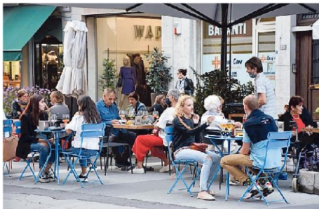
Giovani affollano i plateatici dei locali in corso Trentin nei giorni scorsi