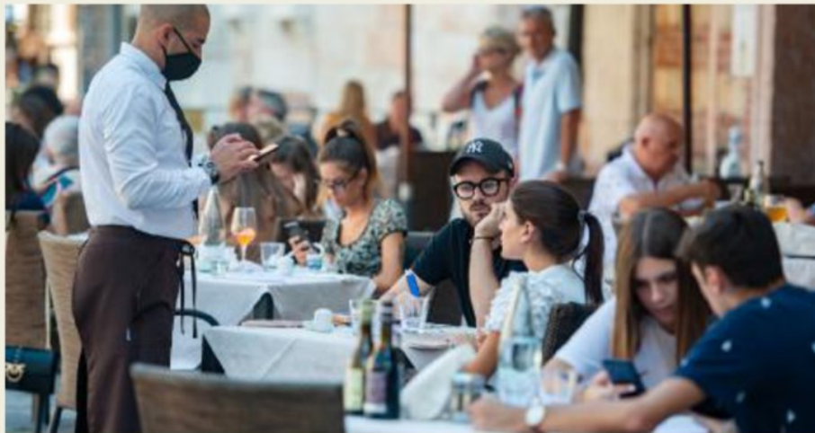
Il rilancio del settore turistico è un altro tema al centro dell'attenzione