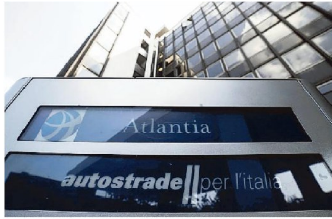
La sede di Atlantia e Autostrade per l'Italia a Roma