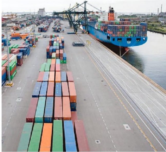
La banchina di uno dei terminal portuali