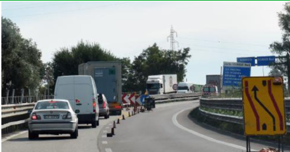
Deviazioni, code e forti disagi sulla Transpolesana a causa della chiusura per lavori di tre svincoli DIENNE