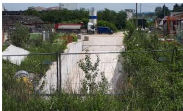
L'imbocco del tunnel di Malo sul quale pendono i sigilli giudiziari