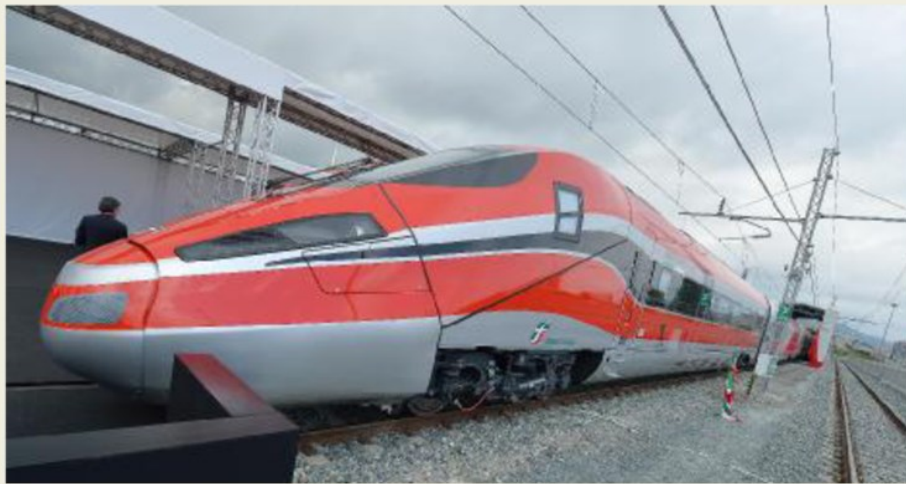
I treni ad alta velocità, una delle priorità del mondo economico