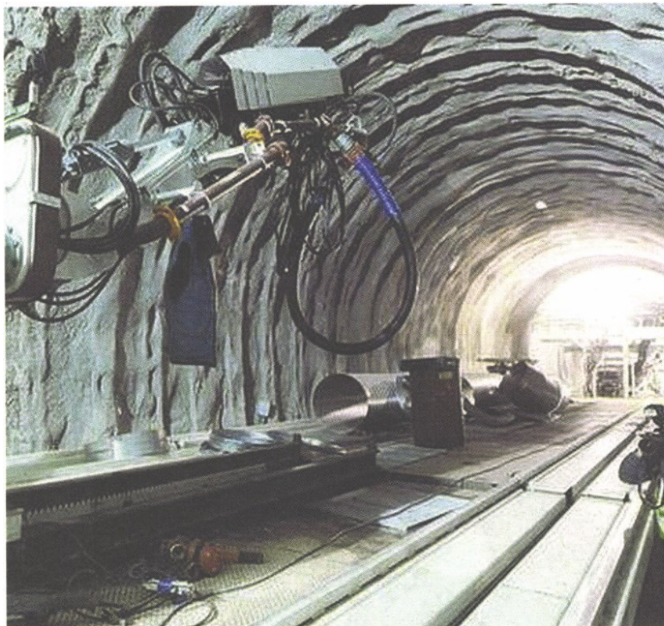
La «talpa» in azione I lavori per la Tav a Lonato del Garda, lungo la tratta fra Brescia e Verona

Miller Il modello da replicare: Vernizzi e il Passante