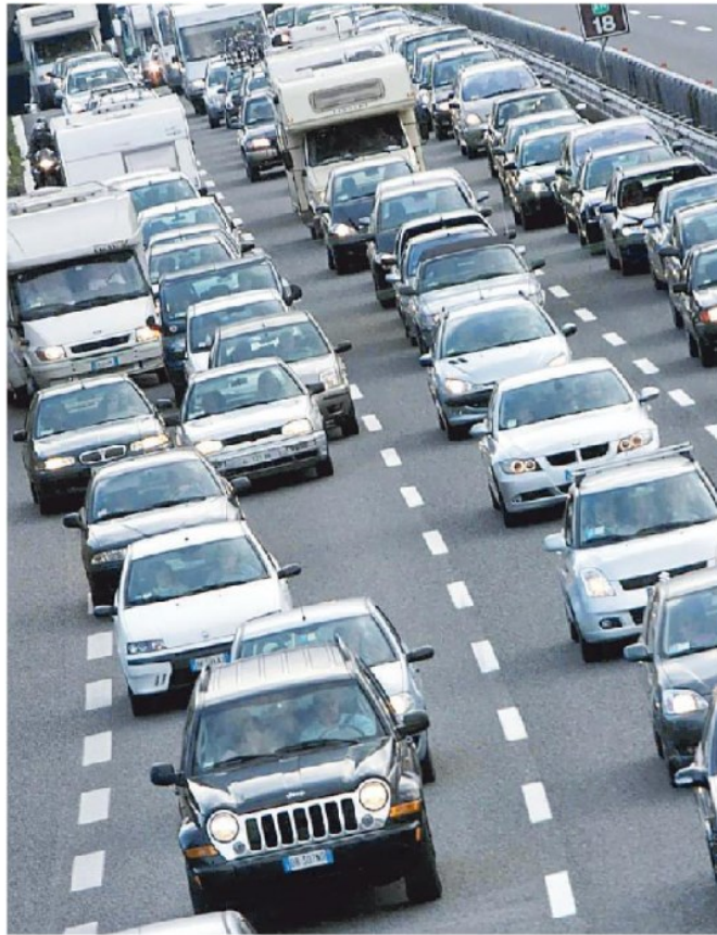
Atlantia detiene l'88% di Aspi, Autostrade per l'Italia