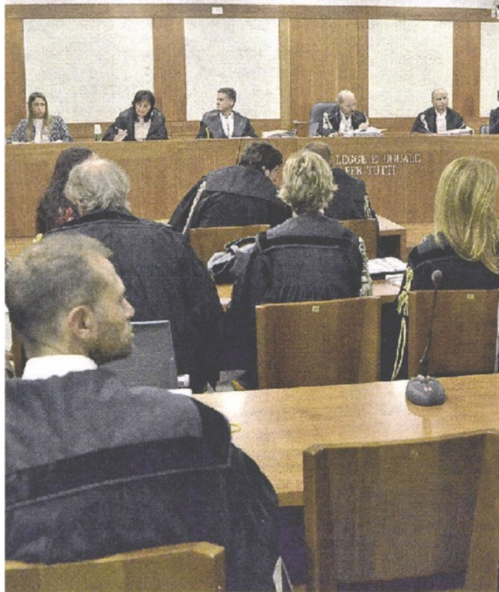
IL PROCESSO Un'immagine dell'udienza dei fronte al Tribunale