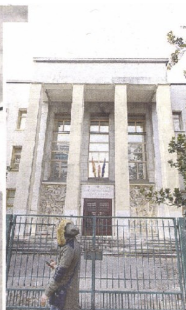
IMPONENTE Una foto d'epoca, scattata nel 1940, dell'"edificio del regio Ginnasio-Liceo", con la "carta dell'impero" sul lato della facciata. Sopra, l'attuale ingresso del Franchetti e, in alto, l'aula magna

ARTICOLO NON CEDIBILE AD ALTRI AD USO ESCLUSIVO DI ANCE VENETO