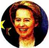
URSULA VON DER LEYEN Presidente della Commissione Ue