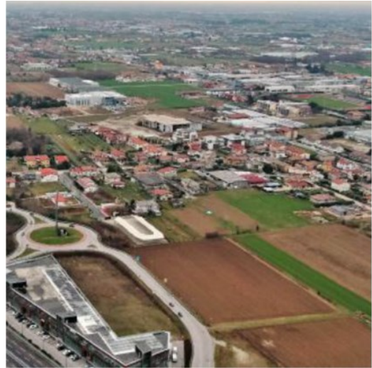
Il punto in cui la Bretella Est raggiunge l'area dell'IperTosano