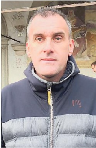
IL COORDINATORE DEI DEPUTATI DEL VENETO DEL PD ROGER DE MENECH