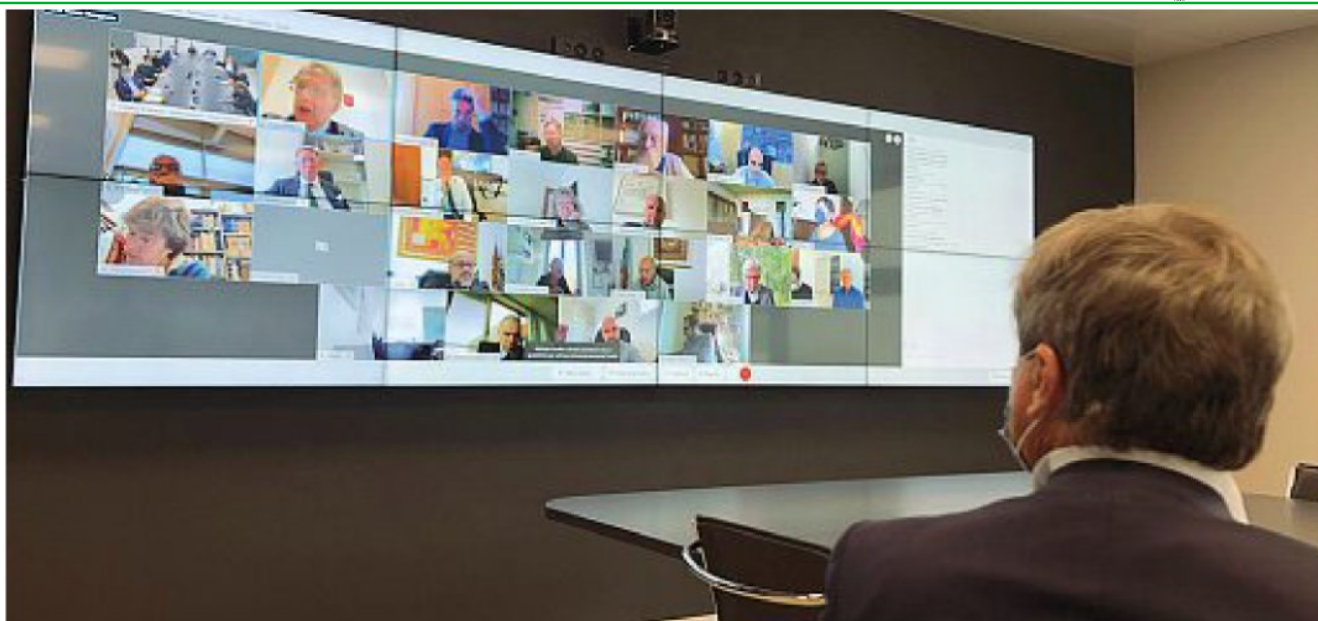
In Smart control room Il sindaco Luigi Brugnaro nel corso della videoconferenza sui problemi del porto con tutti i partecipanti sul monitor