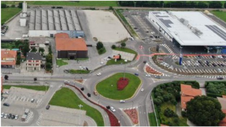
La zona del Grifone. Da questa rotonda sulla ss 47 parte la Bretella Est.