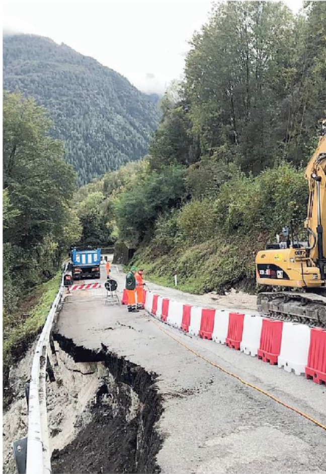
Il fondo servirà a potenziare le infrastrutture delle zone svantaggiate