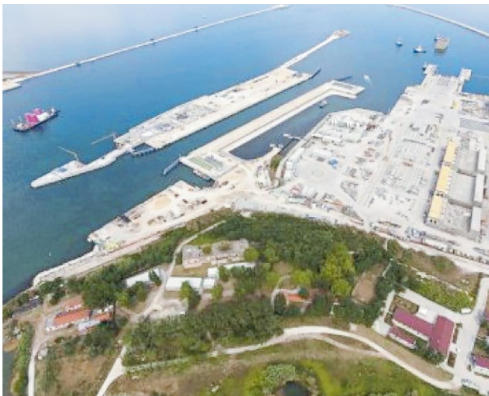
La bocca di porto di Malamocco con la conca di navigazione: ieri la riunione tra Brugnaro e gli operatori