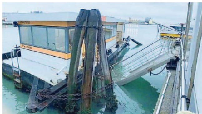
La passerella crollata all'imbarcadero. A destra, un vaporetto