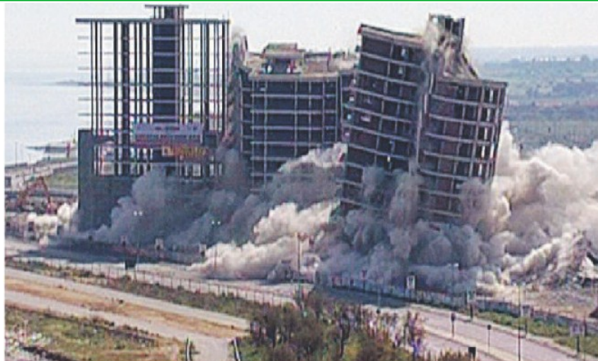
ORA C'È UN PARCO L'abbattimento dei palazzi di Punta Perotti nell'aprile 2006

La realizzazione dei palazzi di Punta Perotti, 300mila metri cubi da realizzare sul lungomare di Bari, cominciò nel 1995 sulla base di una lottizzazione approvata in consiglio Comunale l'11 maggio 1992. Il 17 marzo del 1997 la Procura presso la Pretura circondariale ne ordinò il sequestro ipotizzando reati edilizi: tutte le sentenze successive, pur riconoscendo l'abusivismo delle opere perché non conformi alla legge (la «Galasso» che impone una distanza minima dal mare), hanno infatti assolto i costruttori che proprio per questo hanno poi chiesto e ottenuto la condanna dello Stato. La vicenda si chiuse in Cassazione a gennaio 2001 con la conferma della confisca che la Corte d'Appello aveva revocato. Di qui il ricorso alla Corte di Strasburgo, che per quella confisca condannò l'Italia: nel frattempo, ad aprile 2006, i palazzi sono stati demoliti. Nel frattempo, pur essendo stata revocata la confisca, i suoli di Punta Perotti sono rimasti nelle mani del Comune che da anni li ha trasformati in un parco pubblico. I suoli sono sempre edificabili in base al piano regolatore di Bari, ma a impedire una nuova lottizzazione ci sono gli stessi vincoli ambientali che 13 anni fa condussero alla demolizione: i palazzi erano troppo vicini alla linea di costa.