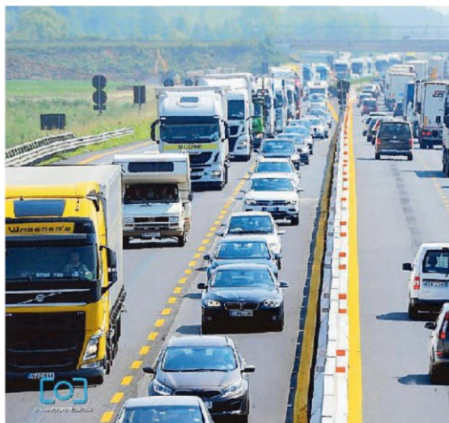
Lunghe code per i lavori della terza corsia sulla A4.

Per consentire una maggiore velocità di intervento (di media tra gli 8 e i 15 minuti) sul luogo in cui verificano le emergenze, sono stati creati 50 accessi all'autostrada (ogni 2 chilometri di cantiere) dalla viabilità ordinaria esterna, attraverso stradelle di servizio. — m.b.