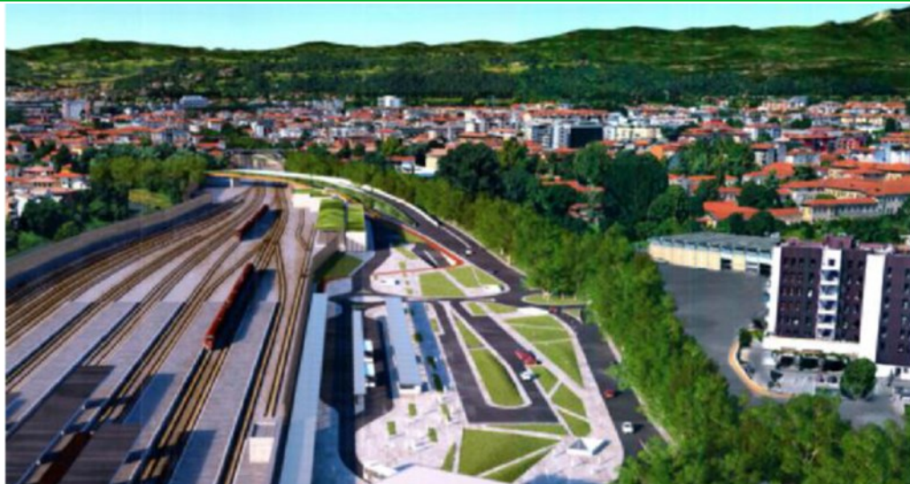
Un rendering del progetto dell'alta velocità/ alta capacità che ridisegna la stazione ferroviaria di Vicenza.