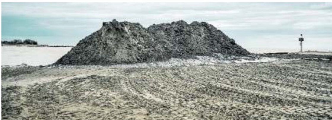
AL LAVORO Cumuli di sabbia nuova trasportati sull'arenile di Cortellazzo