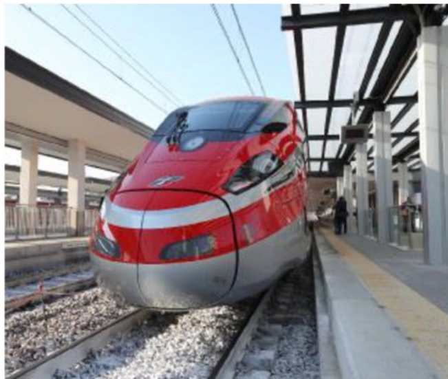
Il vicepremier Luigi Di Maio non ha risposto sull'alta velocità