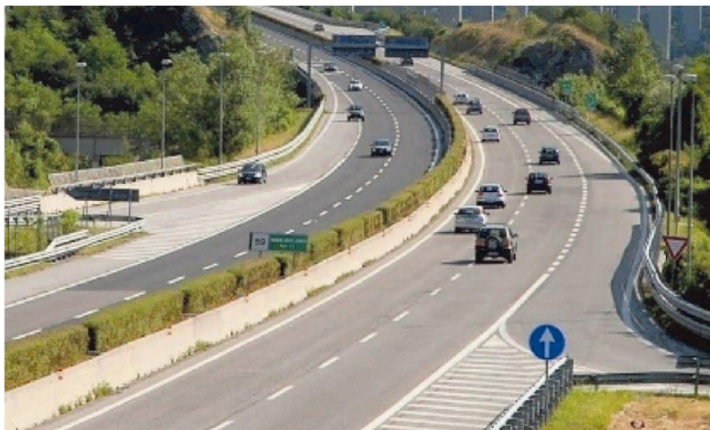
Un tratto dell'autostrada A27 Mestre - Belluno